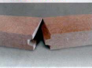
木質繊維ボードでつくる断熱材「イーストボード」

モデルハウスでは遮熱対策をほどこして断熱効果を上げている。メインのアイテムが、木質繊維を固めてつくるボード状の素材だ。上の図はモデルハウス屋根の断面だが、化粧野地の外側にEPS100mmを敷き、その上に木質繊維ボード40mmを施工。さらにその上へ透湿性のある遮熱シートを敷き込んでいる。遮熱シートで熱のふく射を防ぎ、熱容量の大きな木質繊維ボードで熱の伝導速度を遅らせる、という効果をねらった。これについては比較データ