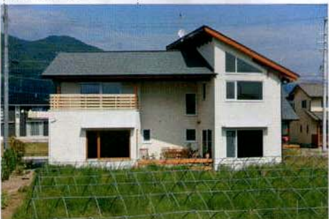
モデルハウス兼住宅の南側外観。冬の日射取得を優先し、開口部を大きくとっている