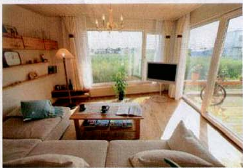
モデルハウス兼住宅の内観。透湿性・調湿性のある無垢の木や塗り壁を用い、水蒸気の移動を妨げない