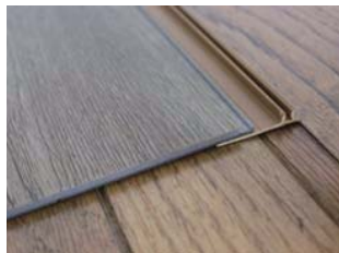
③ 受け台座についているラインに沿って 置き床を敷きます。