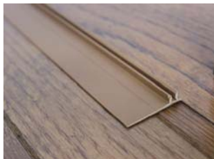
② 必要箇所に貼り付けます。