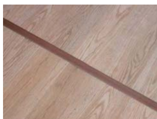
② カバーをはめます。

G-LOC FLOORING・Ultimo はビニール素材のため、温度変化により伸縮します。突き上げを防ぐために、長手方向に 7m 以上施工する場合は見切り材でジョイントしてください。