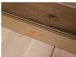
⑤ 受け台座についているラインに沿って 置き床を敷きます。