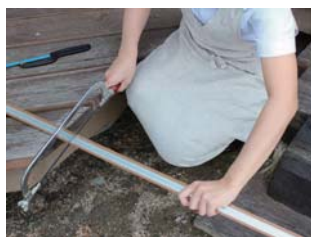
② アルミが切れる道具でカットします。