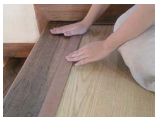
② カバーをはめ込んだら完成です。