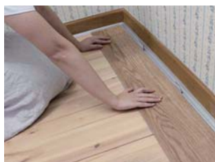
⑤ スペースを挟み、5mm 程度の隙間を空けて置き床を敷きます。