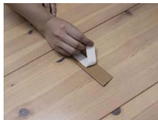
③ 受け台座裏側の両面テープをめくって…