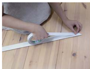
③ 受け台座を取り付けます。接着テープかビスで固定してください。