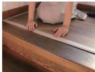
④ カバーをはめ込みます。

G-LOC FLOORING・Ultimo はビニール素材のため、温度変化により伸縮します。突き上げを防ぐために必ず壁から 5mm 程度の隙間を空けてください。