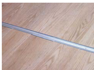
① 受け台座をあらかじめ設置し置き床を敷き詰めます。