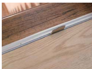
⑤ スペースを挟み、5mm 程度の隙間を空けて置き床を敷きます。