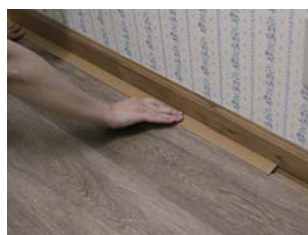
⑥ カバーをはめ込みます。

G-LOC FLOORING・Ultimo はビニール素材のため、温度変化により伸縮します。突き上げを防ぐために必ず壁から 5mm 程度の隙間を空けてください。