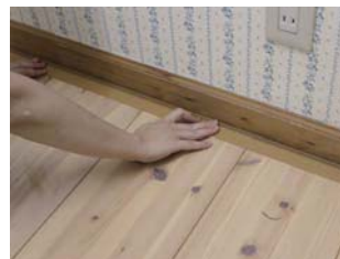
④ 壁際に貼り付けます。