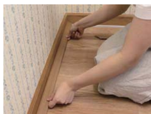
⑥ カバーをはめ込みます。

G-LOC FLOORING・Ultimo はビニール素材のため、温度変化により伸縮します。突き上げを防ぐために必ず壁から 5mm 程度の隙間を空けてください。